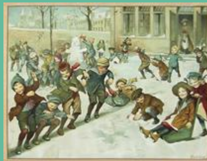
Op de speelplaats in de winter.

In nieuwe richting was een methode voor zowel het aanschouwingsonderwijs als het aanvankelijk en voortgezet onderwijs. Voor kinderen was deze schoolplaat, die zich afspeelt op het ommuurde schoolpleintje, een deel van hun dagelijkse bestaan in de winter.