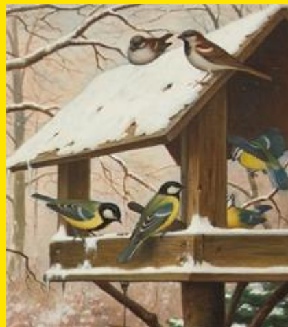
Uitsnede uit de schoolplaat Vogels in de Winter van M.A. Koekoek.