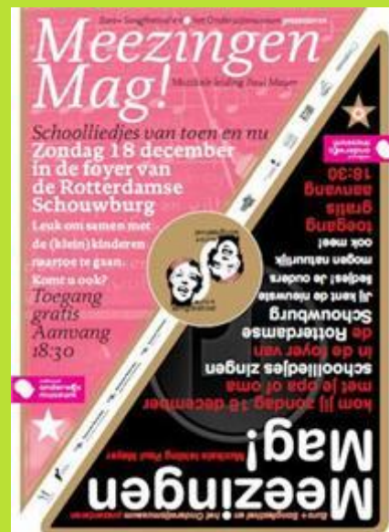
De affiche die op verschillende plaatsen in Rotterdam hangt.